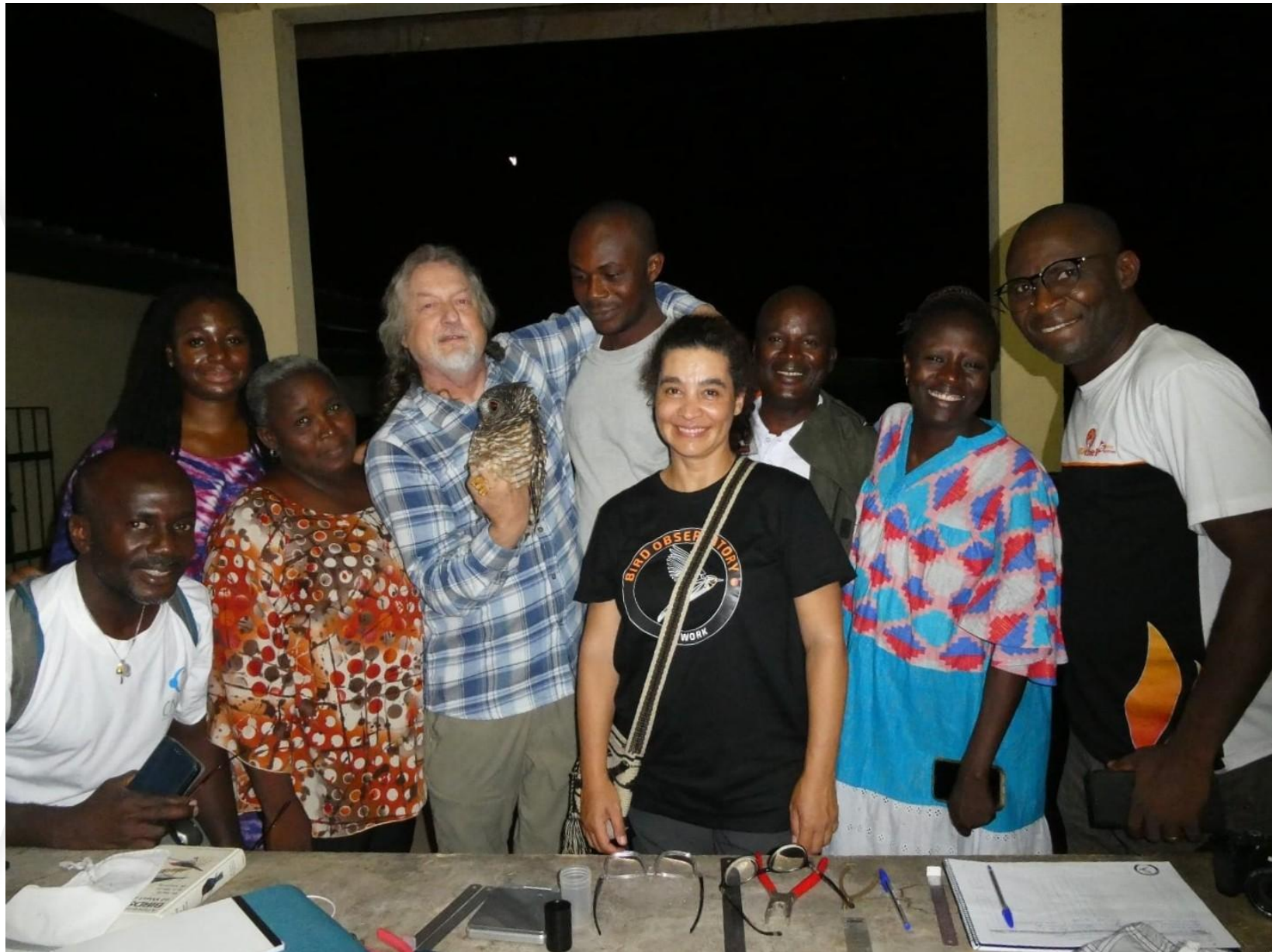
Atelier en Côte d'Ivoire en mai 2024

The school offers training in other African countries and calibration (quality control) workshops for auxiliary and expert bird ringers.